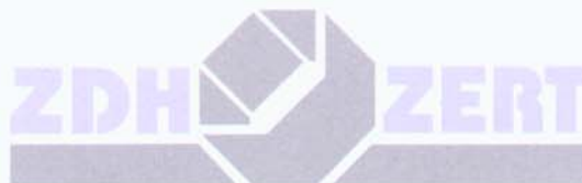
Leiter der Zertifizierungsstelle